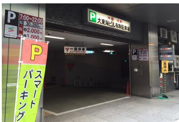
大東海ビル駐車場入り口

名古屋駅周辺は慢性的な駐車場不足が指摘されていますが、今後も事業所等の増加により、ますます駐車場不足が深刻になると予想されます。そのような中、名古屋発の駐車場シェアリングサービス「スマートパーキング」を運営するシードは、名古屋駅前の大東海ビル(名古屋市中村区名駅三丁目 22番 8号)を管理する森定不動産と提携し、同ビルの駐車場において駐車場シェアリングサービスを開始します。2017年1月17日から、16台分の駐車場を「スマートパーキング」の貸し駐車場とします。今後の状況次第では台数の増加も見込まれます。名古屋駅前で10台以上のまとまった駐車場シェアリングサービスの提供は今回が初めてとなり、名古屋駅周辺における駐車場不足の解消に貢献します。