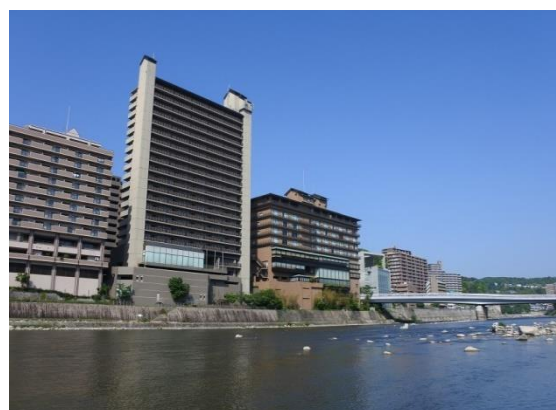
兵庫県住宅供給公社物件の例 (アメニティコート宝塚湯本)